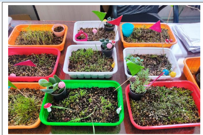
شکل ۱: گلخانه (محل قرار دادن گلدان سبزی‌ها)

هر جلسه از دو بخش تشکیل شده است. بخش اول مرتبط با آموزش و تمرین مهارت‌های مرتبط با توجه پایدار و بخش دوم مرتبط با چالش‌های فردی و گروهی است. در ابتدا مرور تمرینات جلسه قبل انجام می‌شود. سپس پژوهشگر درباره‌ی محتوای جلسه‌ی جدید آموزش‌های لازم را ارائه می‌دهد و دانش‌آموزان در گروه‌های خود به تمرین آن مهارت می‌پردازند. پس از تمرین فردی دانش‌آموزان فعالیت‌های جلسه را به صورت چالش گروهی انجام می‌دهند و با دیگر گروه‌ها رقابت می‌کنند و به کسب امتیاز می‌پردازند. با این شیوه دانش‌آموزان ترغیب می‌شوند تا با دوستانشان در اجرای مهارت‌ها تعامل کنند.