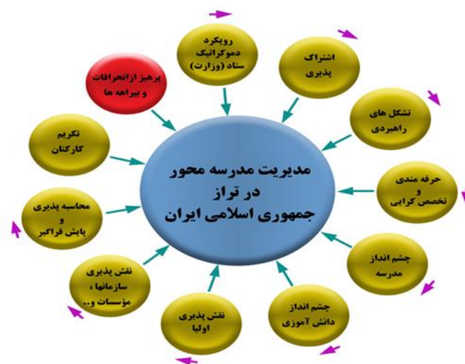
شکل ۲. مهندسی استقرار مضامین سازمان دهنده در شبکه مضامین

مدل پیشنهادی مدیریت مدرسه محور در تراز جمهوری اسلامی ایران چیست؟