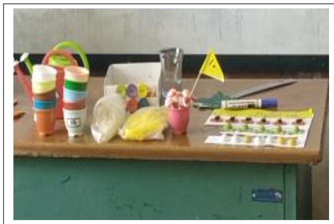
شکل ۲: فروشگاه محصولات باغبانی

هر جلسه از دو بخش تشکیل شده است. بخش اول مرتبط با آموزش و تمرین مهارت‌های مرتبط با توجه پایدار و بخش دوم مرتبط با چالش‌های فردی و گروهی است. در ابتدا مرور تمرینات جلسه قبل انجام می‌شود. سپس پژوهشگر درباره‌ی محتوای جلسه‌ی جدید آموزش‌های لازم را ارائه می‌دهد و دانش‌آموزان در گروه‌های خود به تمرین آن مهارت می‌پردازند. پس از تمرین فردی دانش‌آموزان فعالیت‌های جلسه را به صورت چالش گروهی انجام می‌دهند و با دیگر گروه‌ها رقابت می‌کنند و به کسب امتیاز می‌پردازند. با این شیوه دانش‌آموزان ترغیب می‌شوند تا با دوستانشان در اجرای مهارت‌ها تعامل کنند.