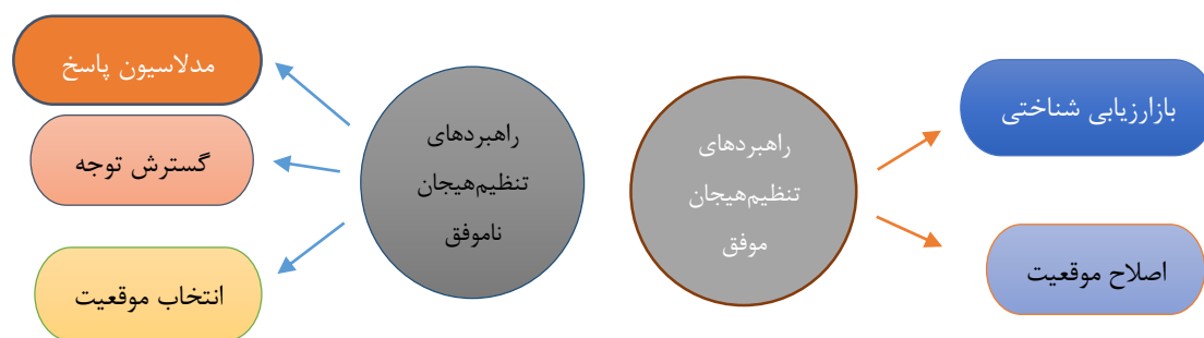
شکل ۱- استراتژی‌های تنظیم احساسات معلمان در مواجهه با رفتارهای مشکل آفرین دانش آموزان

ازش بلند نشه» «دانش آموزان چند بار شلوغی کرد و من چیزی نگفتم بعد پشت سرم شکلک در آورد و من به شدت اون رو تنبیه کردم چون خیلی عصبیم کرد و اگر دکترای علوم تربیتی هم داشتم باز هم علم و دانش را کنار می‌زاشتم و تنبیه می‌کردم. لباس اونو پاره کردم و خیلی بد او را زدم». طبق گزارش‌ها آنان پس از تنبیه و واکنش تند به رفتار دانش آموز، به جای کم شدن بد رفتاری، مدیریت کلاس سخت تر می‌شود و پیامد آن هیجانات منفی بیشتر است. برخی مضامین در خصوص کد جو متشنج عبارت است از: «هرچی تذکر و تنبیه بدنی می‌کنم باز نتیجه نداره. کلاس رو هواست. اون لحظه از عصبانیت سرم داغ میشه» «دانش آموز تقلب کرد، من رفتم روی سرش و اونو زدم و اونم عکس العمل نشان داد، بعدش یکی دیگه آخر سوت می‌کشید، دانش آموز دیگه ای جیغ می‌کشید و بعضی هم می‌رفتن روی میز و صندلی و آهنگ می‌خوندند و می‌رقصیدند. منم فقط یه عصبی ساکت بودم که نگاه می‌کردم». انجام تنبیه خود عواقب و نگرانی‌های ذهنی زیادی برای معلمان به وجود می‌آورد که این سبب نشخوار فکری آنان در محیط دفتر و خانه می‌شود. برخی مضامین کد فرعی نشخوار فکری عبارت است از: «هر وقت تنبیه می‌کنم توی خانه یک هفته بهش فکر می‌کنم. عذاب وجدان زیادی هم می‌گیرم» «دانش آموز را تنبیه کردم و پدرش آمد و گفت ازت شکایت می‌کنم، همش توی ذهنم می‌اومد حتی زمان شام و موقع خواب. دلم زیر و رو می‌شد که چی می‌شه چون گفته بود من این کار تو رسانه‌ای می‌کنم و شکایتت می‌کنم». آنان بسیار مخالف با قوانین آموزش و پرورش در خصوص حمایت از دانش آموزان و عدم داشتن امنیت کافی در مقابل رفتارهای ناهنجار دانش آموزان گزارش دادند، معلمی را شغلی سخت با احساسات منفی بالا و درآمد کم و در کل رضایت کمی از معلمی بیان کردند.